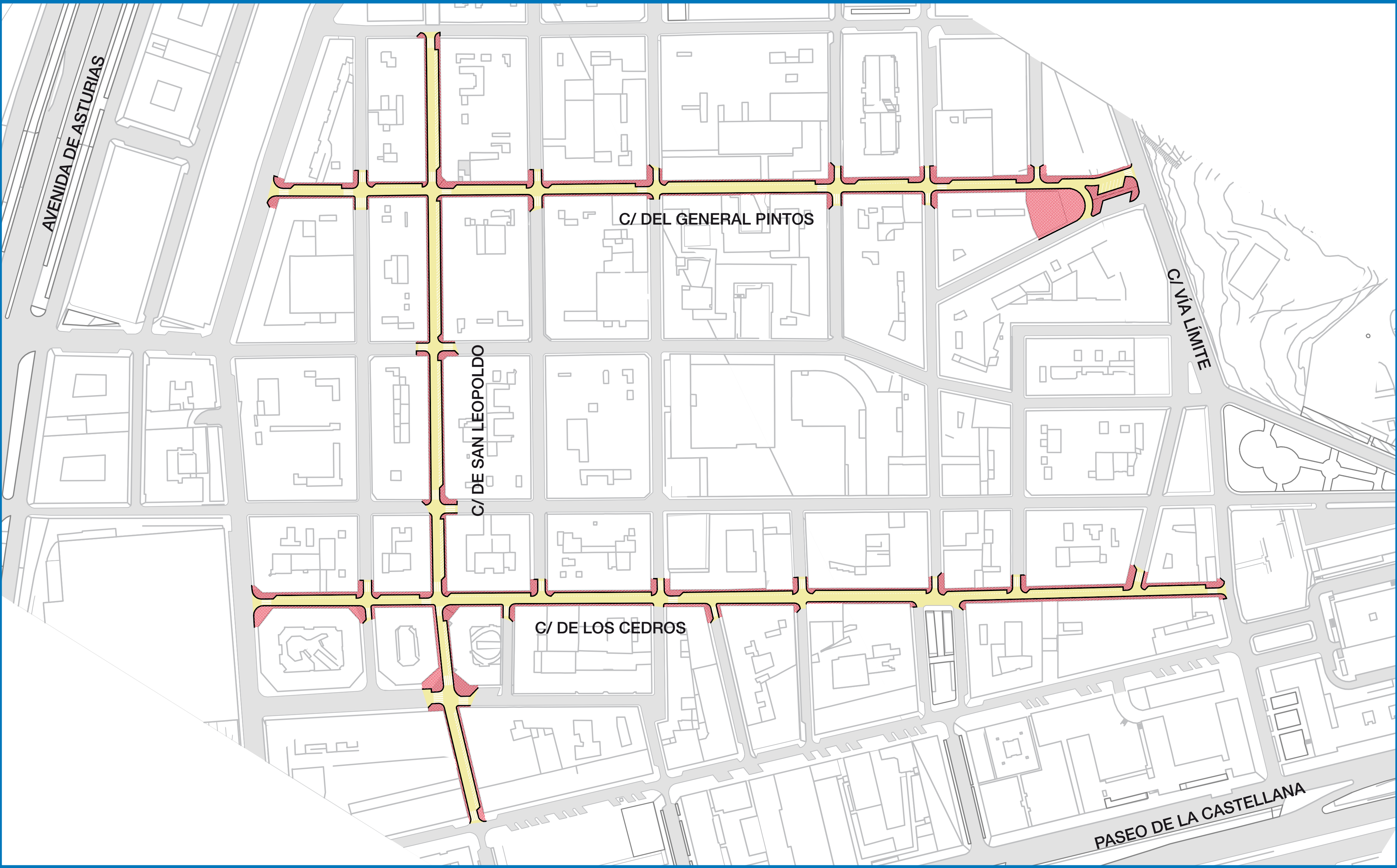
PLANO PLANTA - CALLE DEL GENERAL PINTOS, DE SAN LEOPOLDO Y DE LOS CEDROS